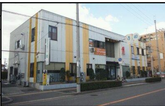
最寄駅 泉北高速鉄道 深井駅、南海バス 深井東町