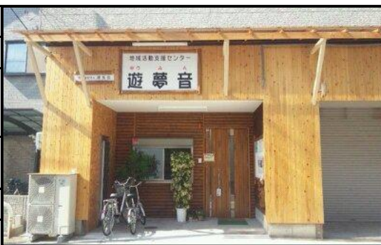
最寄駅 JR阪和線 鳳駅