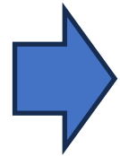
職員アンケート (生活介護11名)